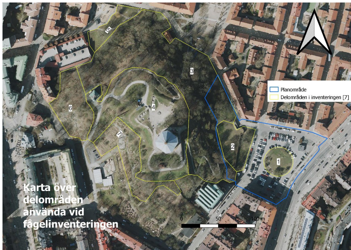
Figur 2. Karta över delområden använda vid fågelinventeringen.

Fågelinventering genomfördes i de delområden som markeras på karta i figur 1. Det är även samma områden som identifierades som naturvärdesobjekt i den tidigare genomförda NVI:n.